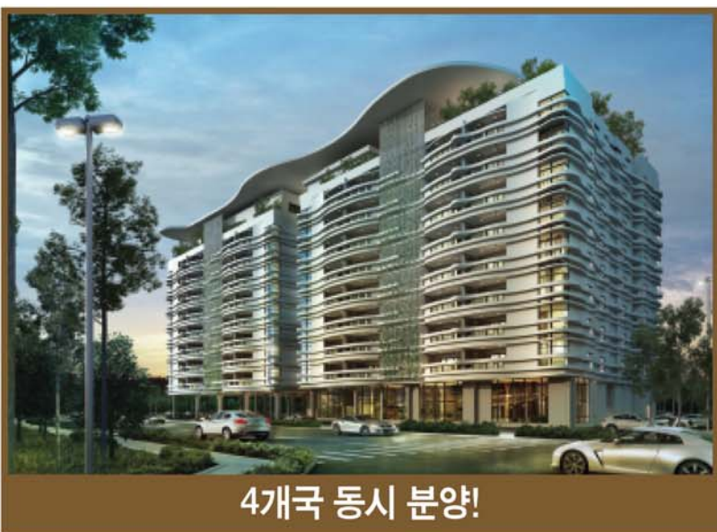
4개국 동시 분양!

※상기 이미지는 이해를 돕기 위한 조감도이므로 실제와 차이가 있을 수 있습니다.